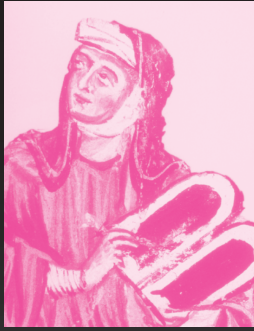
Die hl. Hildegard von Bingen (1098-1179) bei der Niederschrift ihrer Schau von Gott und Welt.